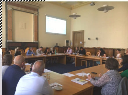
Kulatý stůl s českými a norskými partnery